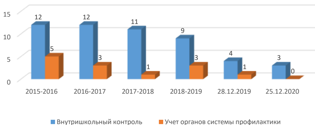
Количество обучающихся МБОУ «СШ №15 им. Героя Советского Союза Н. Токарева», состоящих на учетах органов и учреждениях системы профилактики безнадзорности и правонарушений несовершеннолетних в 2015-2020 гг.

13. С целью повышения уровня правового образования учащихся в школе проводятся месячники правовых знаний и правовые недели.